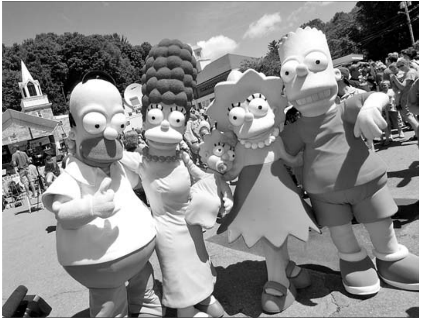
Un grup vestit com els Simpson a l'estrena d' Springfield

El seu director, Matt Groening, ha assegurat aquests dies que la pel·lícula no es