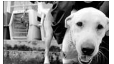
Un home participa amb el seu ca

■ Holanda celebra aquests dies el seu Carnaval. Precisament dilluns passat, el primer dilluns de les festes, va ser el Dilluns Rosa, que és el dia que es dedica als travestis del país.