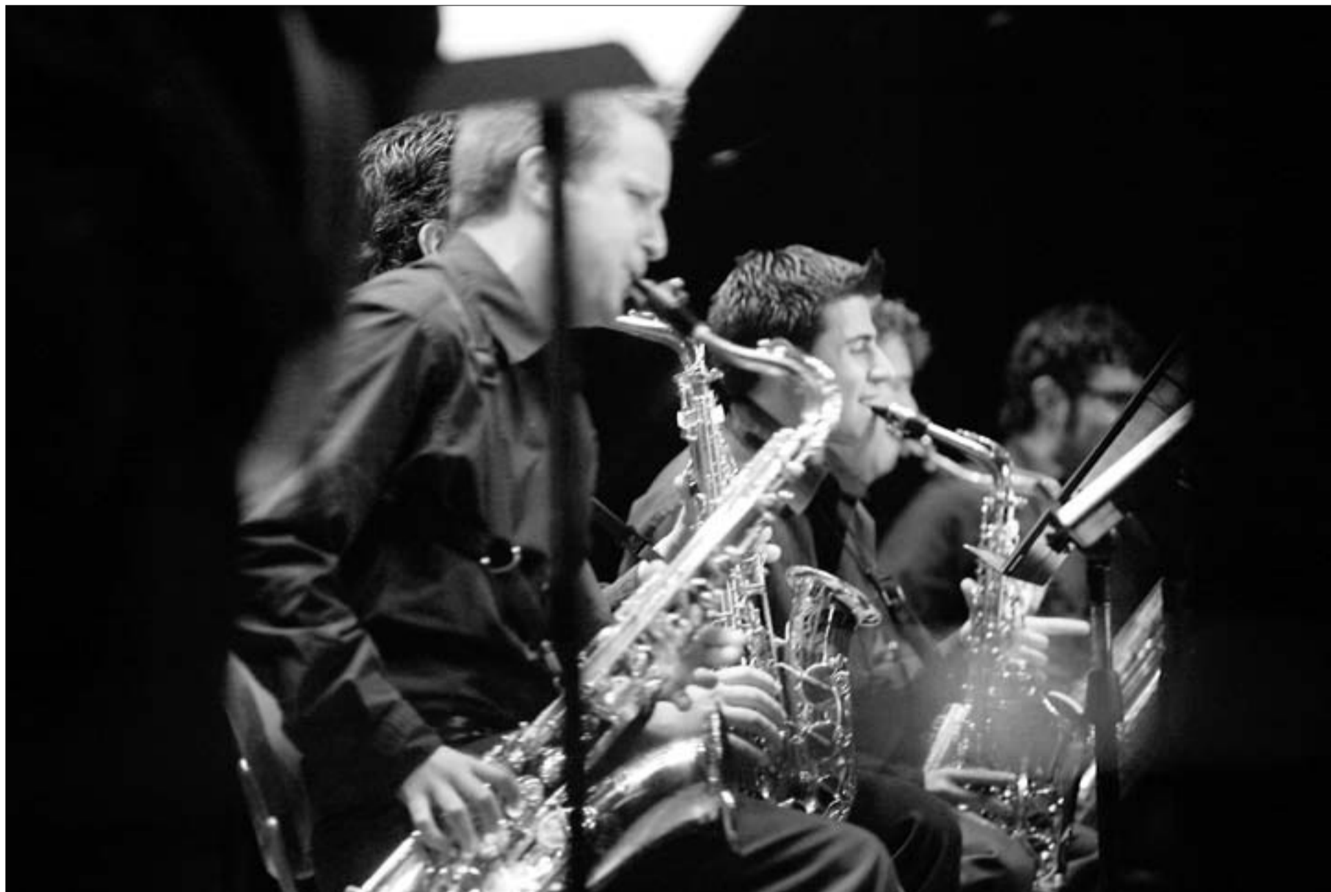
La 'big band' eivissenca va debutar el febrer a l'espai cultural Can Ventosa de Vila

L'Eivissa Jazz, l'antiga Mostra de l'Institut de la Joventut (Injuve), canvia de dates, però manté la seva filosofia de suport als grups professionals i amateurs . Enguany s'estrenarà la nova big band Eivissa Jazz Ensemble, que interpretarà temes de caire «festiu», com correspon a una formació d'aquestes característiques. Els seus components estan il·lusionats i ho donaran tot.