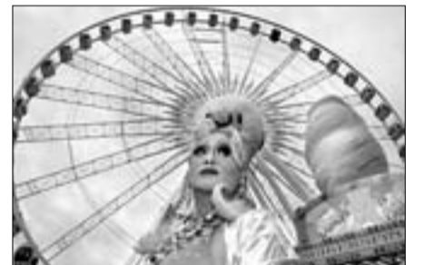
Un travesti a les atraccions