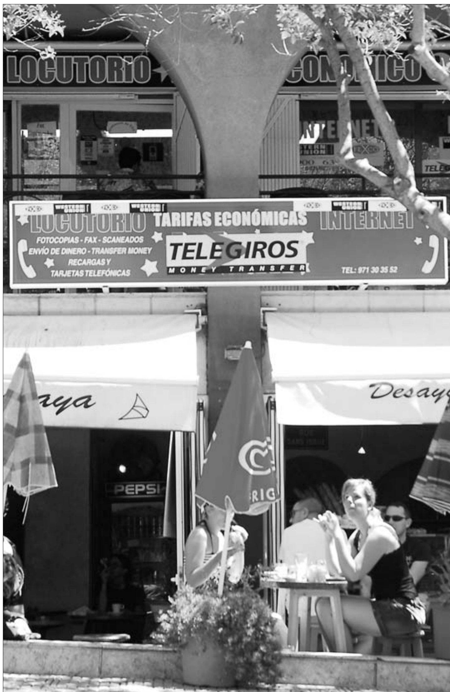
Lloc de pas. Els locutoris se situen a indrets per on passa molta gent. Aquest de dalt està al carrer País Basc, a ses Figueretes