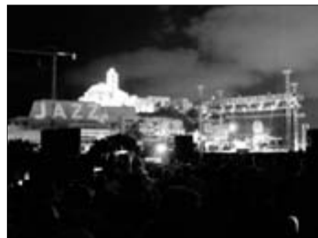
Santa Llúcia acollirà el festival

«Tindrem davant un públic entès, no els podem decebre, haurem d'entregar-nos al màxim», assenyala Prieto. De moment, llevat del debut a l'espai cultural de l'avinguda d'Ignasi Wallis de Vila, l'Eivissa Jazz Ensemble únicament ha fet un directe a l'auditori de Puig d'en Valls. «De to-